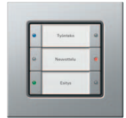
Gira painonappi 3 Komfort, 3-kert. Gira E22, alumiini