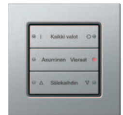
Gira painonappi 3 3-kertainen, jaloterästä, lasertekstillä Gira E 22, jaloteräs