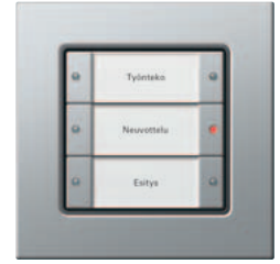
Gira painonappi 3 Perus, 3-kert. Gira E22, alumiini