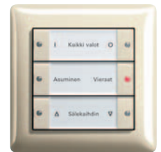
Gira painonappi 3 3-kertainen, puhdasvalkoinen, kiiltävä Gira Standard 55, puhdasvalkoinen, kiiltävä