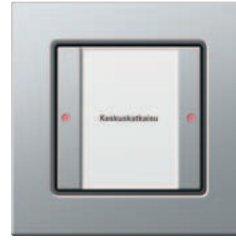
Gira painonappi 3 Perus, 1-kert. Gira E22, alumiini

Gira painonappin 3 avulla voidaan ohjata mitä erilaisimpia järjestelmään liitettyjä väylätoimintoja, kuten esim. valoyhdistelmien ulkoinen tallennus ja avaaminen, valaisimien kytkentä ja himmennys tai sälekaihtimien käyttö. Jokaisessa painikkeessa on kaksi punaista LED-valoa, jotka ilmaisevat niihin kytkettyjen toimintojen tilan. Tekstikentän tausta on hillitysti valaistu, niin että painonappin löytää helposti myös pimeässä ja tekstin voi lukea vaivatta.