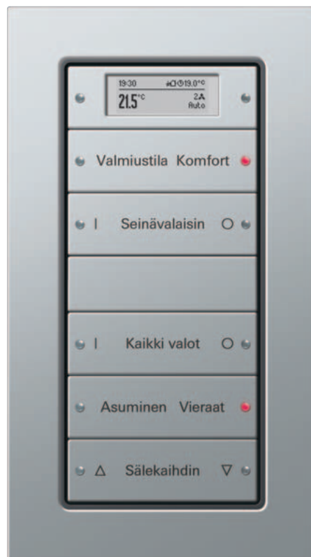
Gira painonappi 3 Plus, 5-kert. Gira E22, alumiini