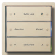
Gira painonappi 3 3-kertainen, puhdasvalkoinen, kiiltävä Gira F100, puhdasvalkoinen, kiiltävä