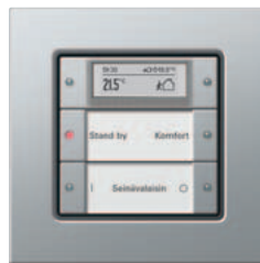
Gira painonappi 3 Plus, 2-kertainen Gira E22, alumiini

Gira painonappiin 3 Plus kuuluu integroitu huoneenlämpötilan säädin sekä suurikontrastinen näyttö säätimen tilan, lämpötilan ja erilaisten KNX/EIB-järjestelmän kautta vastaanotettavien ilmoitusten näyttämiseksi. Näytössä palaa yötilassa valkoinen taustavalo, ja arvot ja ilmoitukset on mahdollista saada näkyviin sille eri kokoisina ja eri näyttötiloissa. Yhdessä ulkoisella anturiliitännällä varustetun väyläliittimen 3 kanssa voidaan järjestelmään liittää ulkoinen lämpötila-anturi, esim. lattialämmitystä varten.