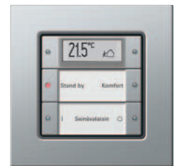
Gira painonappi 3 Plus, 2-kertainen Gira E22, alumiini