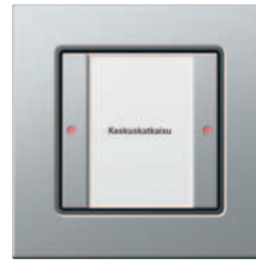
Gira painonappi 3 Komfort, 1-kert. Gira E22, alumiini

Gira painonappi 3 Komfort on varustettu kolmivärisillä LED-valoilla, jotka ilmaisevat sen tilan, ja joihin voidaan tämän lisäksi ohjelmoida myös moninaisempia toimintoja. Tämän lisäksi siihen on integroitu lämpötila-anturi, joka voidaan yhdistää muihin KNX/EIB-järjestelmän komponentteihin. Jokaiseen painikkeeseen voidaan ohjelmoida myös ensisijaisesti käsiteltävä tilan kuittaus, esim. hälytysilmoituksia tai tuulihälytyksen kaltaisia ilmoituksia varten.