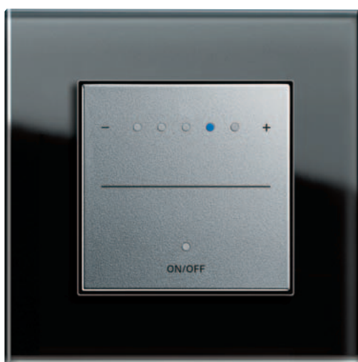
Gira Touchdimmer, kleur aluminium Gira Esprit, glas zwart